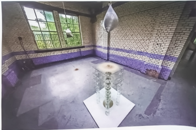
In het werk van de Leidse kunstenaar Karl Karlas lopen twee zandzakken heel langzaam leeg.

Theo de With schreef een artikel voor het Leidsch Dagblad